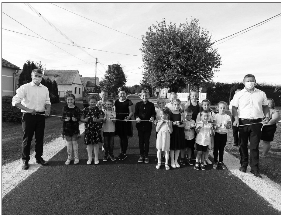
Útátadás (Dózsa György utca)

i) minden olyan helyiségben, amelyben tömegközlekedési eszközre várakoznak,