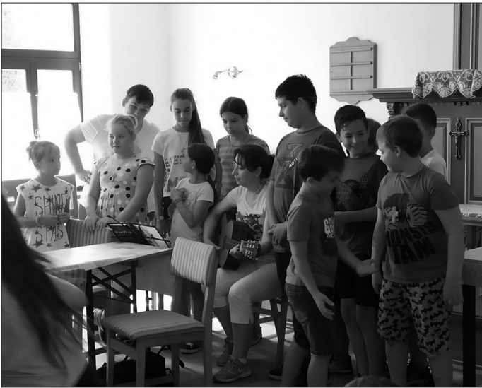
Éneklés a rábapatyi templomban

Az idei nyáron is táboroztak az evangélikus hittanosok Rábapatyon