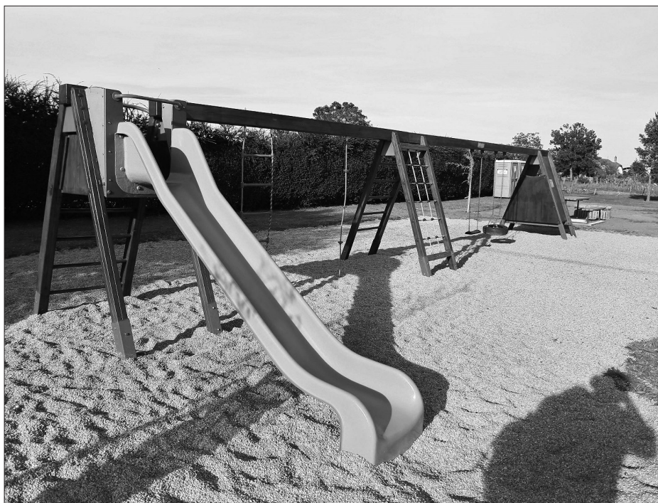
Játszótér avatás (Dózsa György utca)

Prof. Dr. Kásler Miklós miniszter 2020. szeptember 21-i dátummal körlevelet intézett a köznevelési intézmények veze-