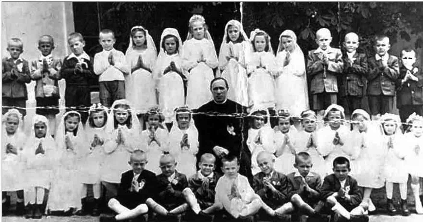
Elsőáldozás Felsőpatyon 1947. május 14-én.