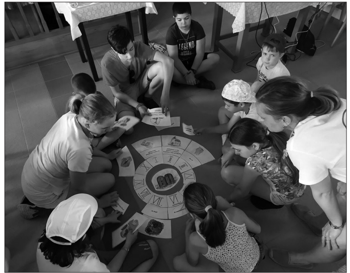
Játékos bibliai vetélkedő

A Sárvári Evangélikus Egyházközség az idei évben is megszervezte napközis hittantáborát, ahova általános iskolás gyerekek jelentkezését várták a lelkészek.